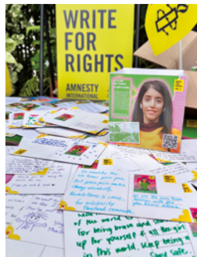
Петиции и открытки в поддержку Манахель Аль-Отайби, «Марафон писем» 2024.

ПОЧУВСТВОВАТЬ эмоциональную вовлечённость, сформировать ценности и личное отношение к теме.