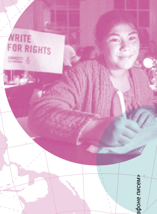
Сторонники Amnesty участвуют в «Марафоне писем» 2024 в Нидерландах.

AMNESTY INTERNATIONAL – ВСЕМИРНОЕ ДВИЖЕНИЕ В ЗАЩИТУ ПРАВ ЧЕЛОВЕКА. КОГДА НЕСПРАВЕДЛИВОСТЬ ПРОИСХОДИТ С ОДНИМ ЧЕЛОВЕКОМ – ЭТО КАСАЕТСЯ ВСЕХ НАС.