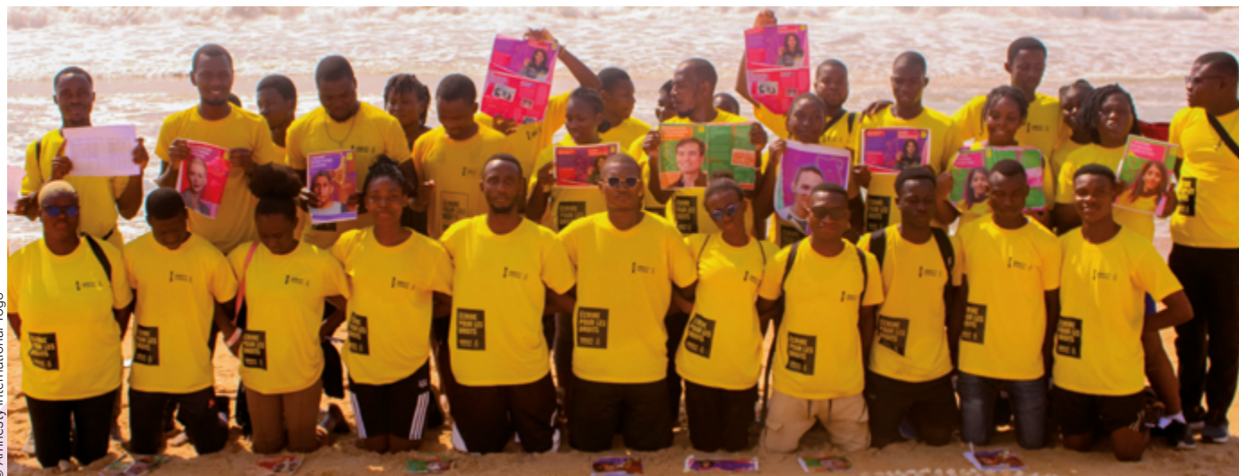
Активисты Amnesty в Того во время «Марафона писем» 2024.

нормами в обращении с отдельными людьми. Права человека вошли в международное законодательство, поскольку после принятия ВДПЧ на основе её принципов было составлено множество других обязательных к исполнению законов и договоров. Эти законы и договоры обеспечивают основание для таких организаций, как Amnesty International, требовать от правительств прекратить нарушения прав человека, от которых пострадали люди, ставшие героями нашей кампании «Марафон писем».