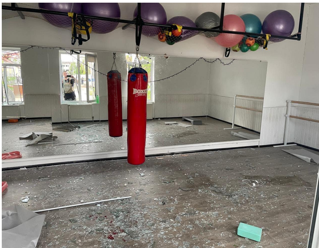
The aftermath of the attack on the sports club in Derhachi, Kharkiv oblast, 2 May 2024.