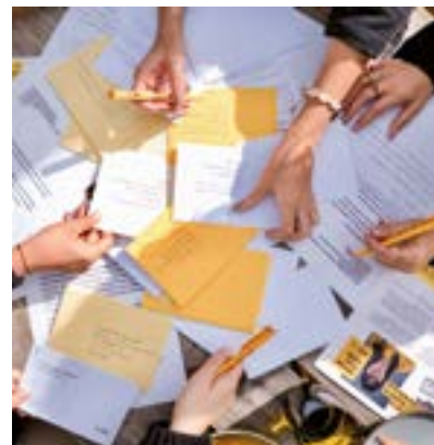
Хаттар марафоны 2023 аясында Чехияда достарымен бірге хат жазып отырған сәті

эмоциялық түрде толыққанды қатысу және өз көзқарастарын дамыту МҮМКІНДІГІНЕ ИЕ БОЛАДЫ.