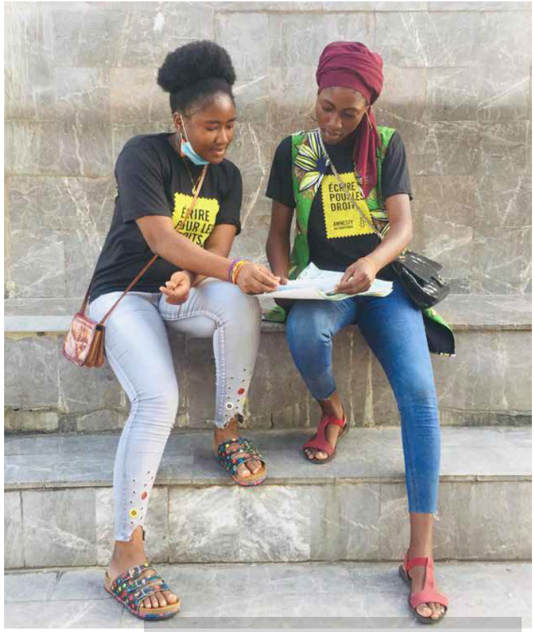
273808 Amnesty International Benin - W4R 2020

Адам укуктары – бул иш жүзүндө мүмкүнчүлүк болгондо гана канааттандыра турган жыргалчылык эмес.