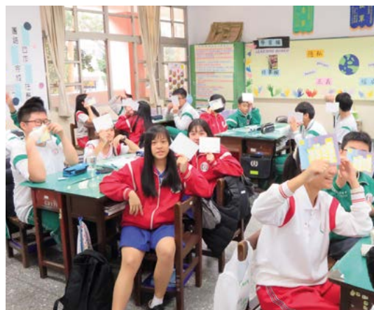
Школьники и учителя на Тайване организовали мероприятия по написанию писем вместе с Amnesty International в рамках «Марафона писем» в 2019 году.

Если вы не знакомы с методами обучения, основанными на активном участии, пожалуйста, до начала занятий загляните в специальное пособие Amnesty International, которое вы найдете здесь –: www.amnesty.org/en/documents/ACT35/020/2011/en/