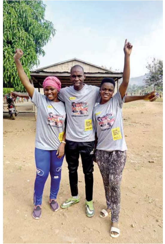
Команда Amnesty International Togo участвует в «Марафоне писем» в 2019 году. Каждый год они собирают людей со всей страны, чтобы они приняли участие в этой кампании.

После страшных преступлений, совершённых в ходе Второй мировой войны, международные договоры по правам человека, начиная с Всеобщей декларации прав человека, заложили прочную основу для национального, регионального и международного законодательства, призванного улучшить жизнь людей во всём мире. Права человека можно рассматривать как законы для правительств. Они налагают на правительства и должностных лиц обязательства соблюдать, защищать и обеспечивать реализацию прав тех, кто находится как под их юрисдикцией, так и вне её.