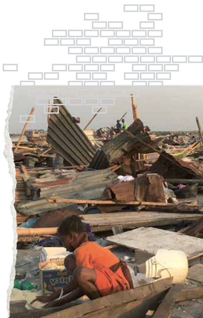
После выселения в Отодо Гбаме