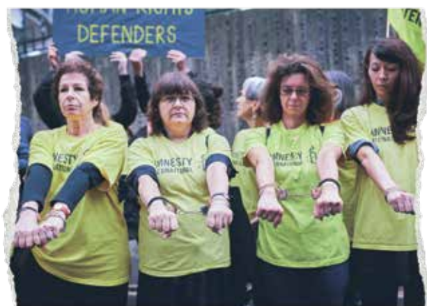
Члены Amnesty International протестуют перед посольством Турции в Париже, июль 2017 года.

Наша деятельность защищает людей и помогает им – от отмены смертной казни до продвижения сексуальных и репродуктивных прав, и от борьбы с дискриминацией до защиты прав беженцев и мигрантов. Мы помогаем привлекать к ответственности тех, кто применяет пытки. Менять репрессивные законы... И освобождать людей, которых бросили в тюрьмы лишь за то, что они высказали своё мнение. Мы выступаем в защиту всех и каждого, на чью свободу и достоинство посягают.