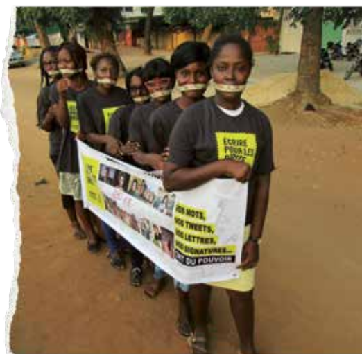
Активисты «Марафона писем» в Того.

Права человека – это не роскошь, которую можно соблюдать лишь тогда, когда это целесообразно.