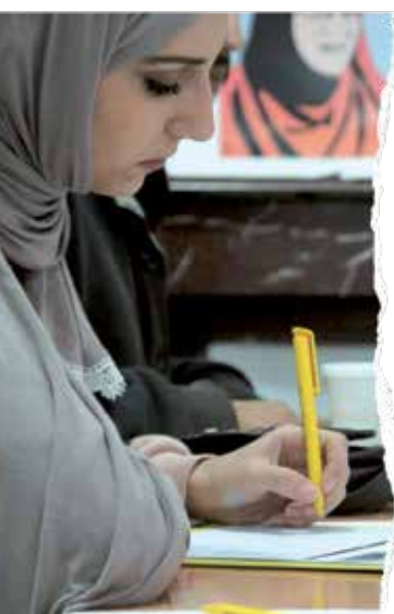
В Алжире пишут письма для «Марафона писем».