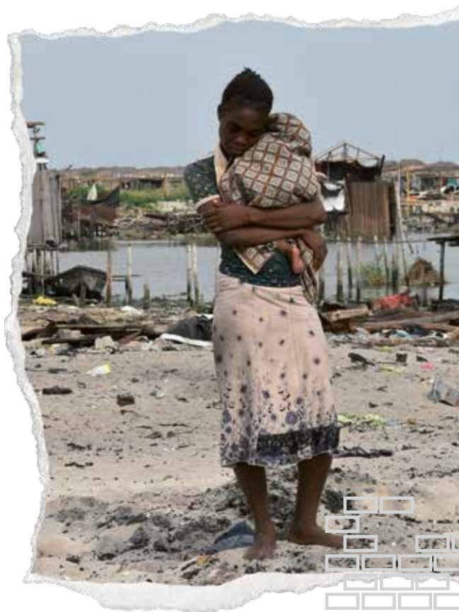
После выселения в Отодо Гбаме