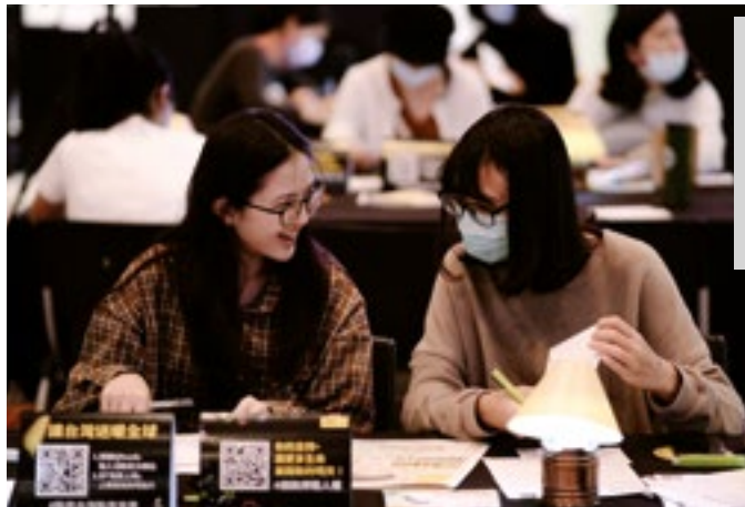
«Марафон писем» Amnesty International на Тайване, декабрь 2020

Amnesty не только проводит акции по написанию писем, но также обращается к тем, у кого есть власть и полномочия, чтобы изменить положение этих людей, например, к политикам из их стран. «Марафон писем» также проводит публичные мероприятия и