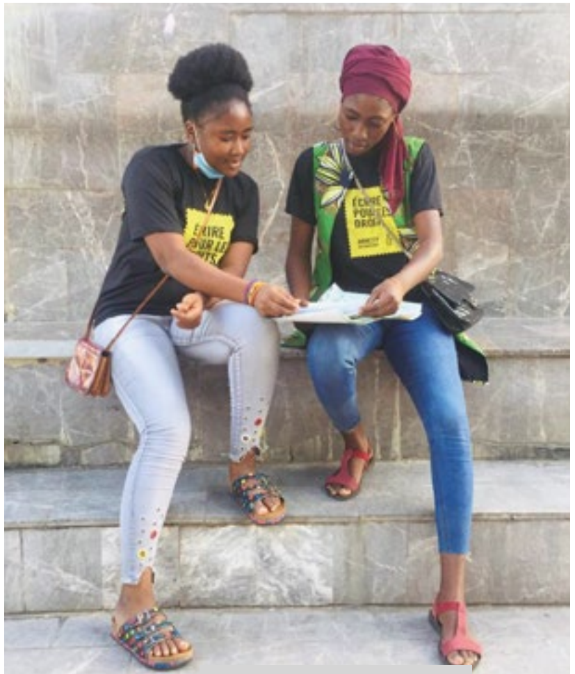
«Марафон писем» Amnesty International в Бенине, декабрь 2020

Права человека – это не роскошь. Их нельзя соблюдать лишь тогда, когда это целесообразно.