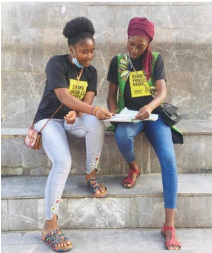
Эл аралык Мунапыс Уюмунун Бениндеги кат жазуу иш-чарасы, декабрь -2020

Адам укуктары - бул иш жүзүндө мүмкүнчүлүк болгондо гана канааттандыра турган жыргалчылык эмес.