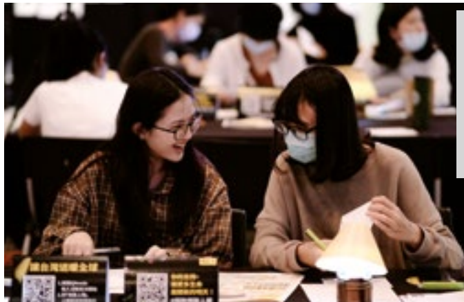
Эл аралык Мунапыс Уюмунун Тайвандагы кат жазуу иш-чарасы, декабрь -2020

Мунапыс Уюму кат жазуу аракеттери менен бирге, бул адамдардын абалын өзгөртүүгө күчү бар, алардын