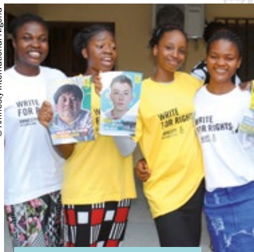
Активисты Amnesty из Нигерии участвуют в «Марафоне писем» 2021.

Почитайте о людях, за которых мы боремся: https://eurasia.amnesty.org/marafon-pisem/