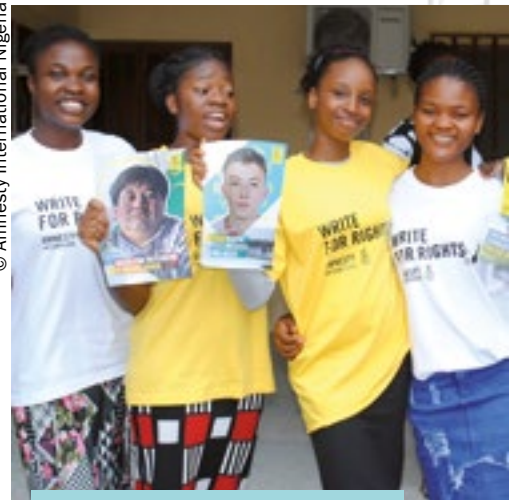
Активисты Amnesty из Нигерии участвуют в «Марафоне писем» 2021.

Почитайте о людях, за которых мы боремся: https://eurasia.amnesty.org/marafon-pisem/