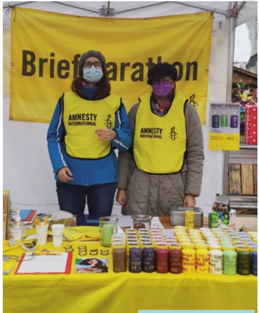
Активисты Amnesty из Швейцарии участвуют в «Марафоне писем» 2021.

Права человека – это не роскошь. Их нельзя соблюдать лишь тогда, когда это целесообразно.