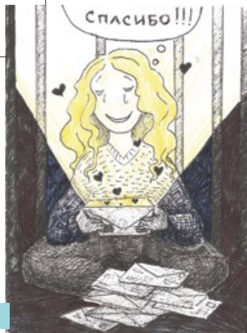
Рисунок, нарисованный Александрой под стражей.

Aleksandra Skochilenko Write for Rights Amnesty International 1 Easton Street London WC1X 0DW United Kingdom