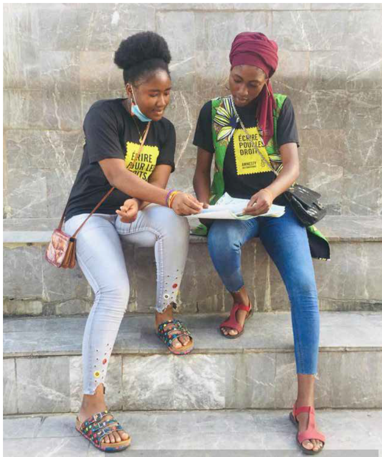
273808 Amnesty International Benin - W4R 2020

Права человека – это не роскошь. Их нельзя соблюдать лишь тогда, когда это целесообразно.