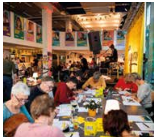
“Кат жазуу марафону” иш чарасы - Антверпен, Бельгия, 2022 ж.

Өз-ара эмоционалдуу иштешүү жана жүрүм-турумдарын өнүктүрүү үчүн керек болгон МЕЙКИНДИКИ ТАБАТ